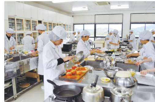
鹿児島純心女子大学 における実習