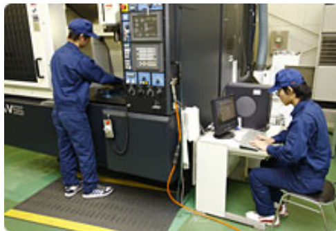
ポリテクカレッジにおける実習

○本市の地域成長戦略においては、戦略の筆頭として「観光・交流人口の拡大による観光産業の育成」とともに、「未来を切り拓く地域産業の創出」を掲げ、3つの柱として「食品ビジネス」、「次世代エネルギービジネス」、「医療・介護周辺ビジネス」が位置づけられており、関連産業の育成につなげていく。