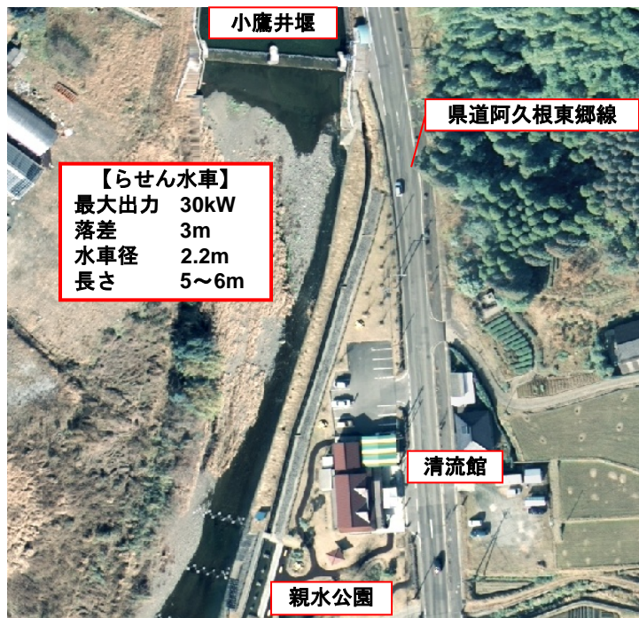
設置場所付近の位置関係