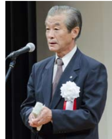
薩摩川内市長 岩切秀雄 代理 薩摩川内市 副市長 向原 翼